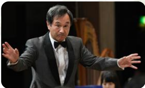
音楽監督・春日先生

2019年 7.13 (土) 第1部：開場 /12:00 開演/12:30 第2部：開場/ 14:30 開演/15:00