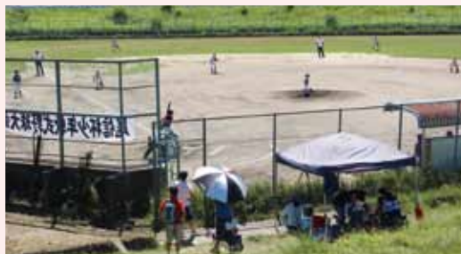
尾信杯少年野球大会 (H30.8)