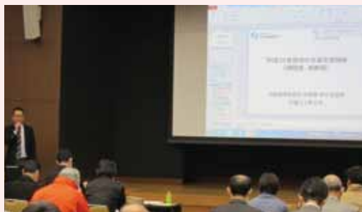
補助金・税制等 中小企業施策活用セミナー (H31.2)