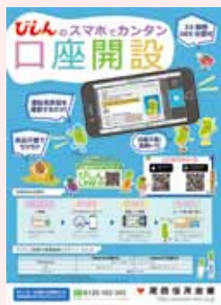
スマートフォンによる 口座開設サービス (H30.7)