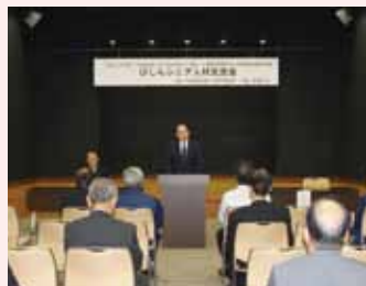
びしんシニア人材交流会 (H30.10)